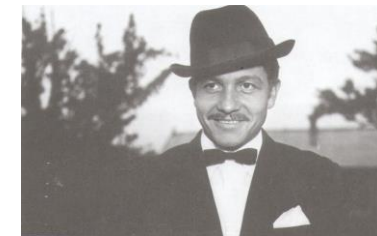
În rolul lui Obadă din filmul „Singur în fața dragostei”