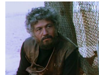
În rolul lui Budulai din filmul „Țiganul”