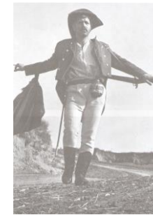
În rolul lui Ivan Turbincă din filmul „Se caută un paznic”