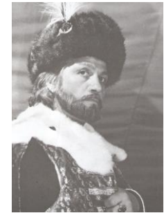
În rolul lui Dimitrie Cantemir din filmul „Dimitrie Cantemir”