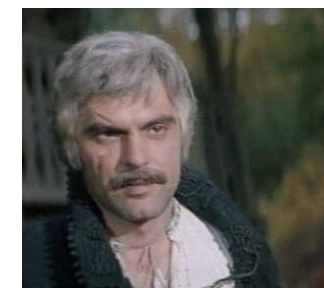
În rolul Radu Negostin din filmul „Lăutarii”