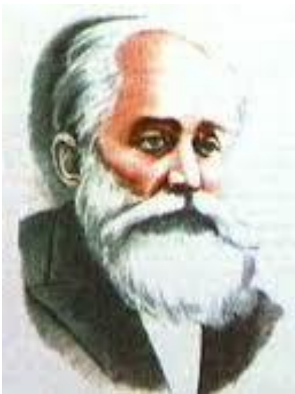
BOGDAN PETRICEICU HASDEU